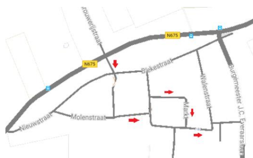
Figuur 1 - Huidige verkeers-circulatie plan

verkeers-circulatie zijn er een aantal opties mogelijk. De Blekestraat één-richting maken is de meest voor de hand liggende. Dit kan in beide richtingen, maar gezien de Molenstraat al één-richting is heb je vanuit de Markt zo geen makkelijke ontsluiting meer richting Nieuwvliet. Er wordt dus geopperd om de Blekestraat één-richting te maken van de Nieuwstraat naar de Walenstraat.